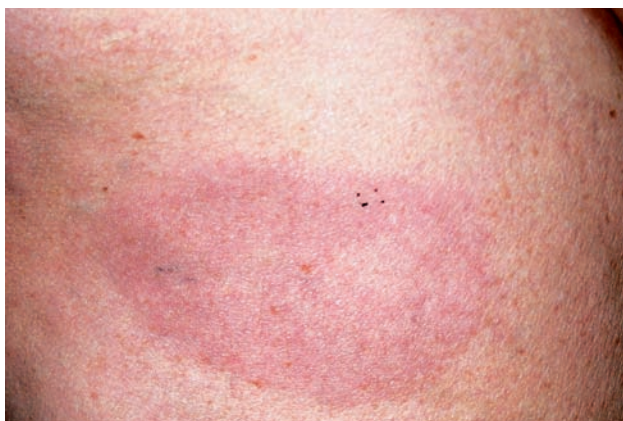
Obr. 4. Granuloma anulare – erytematózní forma (Dermatovenerologická klinika 1. LF UK a VFN)

Perforující forma GA se klinicky projevuje jako malé papuly s centrálními prohlubněmi krytými krustami nebo fokálními ulceracemi na hřbetech rukou a prstech [2, 12]. Představuje asi 5 % všech případů GA, histologicky představuje transepidermální eliminaci degenerovaného kolagenu [2].