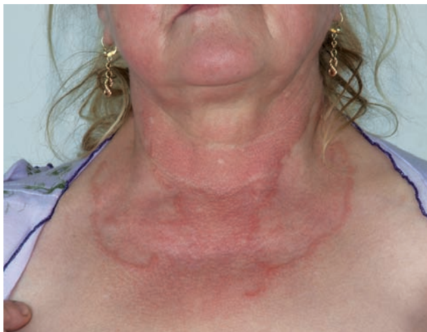
Obr. 3. Granuloma anulare – rozsáhlé anulární projevy

Generalizovaná forma GA (GGA) se vyskytuje v 8,5–15 % všech případů GA [5]. Je definována přítomností nejméně deseti současně se vyskytujícími anulárními ložisky nebo rozsáhlými anulárními ložisky (obr. 3) [32]; většinou jsou přítomny stovky malých, růžovo-fialových papul na trupu i končetinách, které mohou tvořit anulární ložiska [2]. Nejčastěji postihuje děti ve věku do 10 let a ženy ve věku nad 40 let [5]. Generalizovaná forma GA se vyznačuje dlouhou dobou trvání a mnohem nižším počtem spontánních zhojení. Výskyt generalizované formy bývá spojen s pozitivitou HLA-Bw35 antigenu [8].