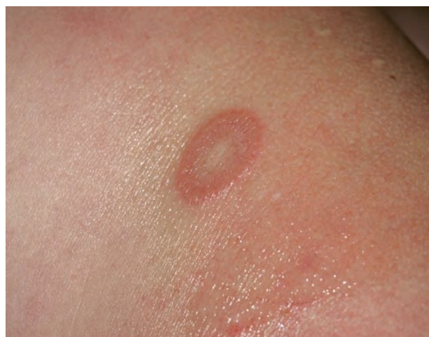
Obr. 2. Granuloma anulare – anulárního ložisko