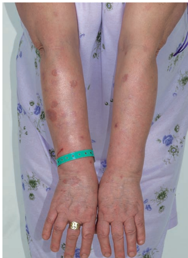
Obr. 1. Granuloma anulare – mnohačetná anulární ložiska

ních i dolních končetinách, v 5 % jen na trupu a přibližně v 5 % ve všech lokalitách. Na obličejí jsou projevy zřídka. Ložiska jsou barvy kůže, růžová, nebo fialová, okraj ložisek je složený z jednotlivých drobných, několikamilimetrových papul, v centru obloukovitých až anulárních ložisek je intaktní kůže (obr. 2). Anulární ložisko má zpravidla průměr několika centimetrů. Solitární papuly s centrální depresí v úrovni kůže (papulárně-umbilikální forma) nebo noduly se nejčastěji vyskytují na prstech. Lokalizovaná forma GA se objevuje nejčastěji u pacientů do 30 let věku, 2krát častěji u žen [2].