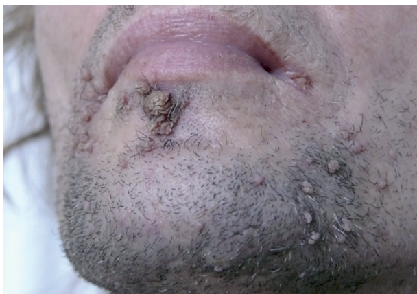
Obr. 1. Verrucae vulgares u HIV pozitivného pacienta na brade a v periorálnej oblasti

Pacient je monitorovaný pre HIV infekciu a v súčasnosti liečený trojkombináciou spomínaných anti-HIV liekov, ktorú užíval aj počas lokálnej liečby HPV infekcie 5% imiquimodom. Lokálna terapia imiquimodom sa aplikovala cielene na prejavy 3x týždenne počas 1 mesiaca. Postupne došlo k deštrukcii patologických lézií iba s miernou lokálnou reakciou v podobe erytému. Iné lokálne ani celkové vedľajšie účinky neboli zaznamenané. Počas ročného sledovania je pacient bez prejavov HPV infekcie.