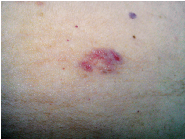
Obr. 1. Fibroepitelióm

asi 2 x 1 cm okrúhleho tvaru, hladkého povrchu, belavoružovej farby s červeným ostrovčekom vo vnútri (obr. 1). Okolie lézie bolo kludné. Pacientka udávala vznik ložiska pred 14 rokmi po obarení horúcou masťou. Subjektívne bola bez ťažkostí. Ložisko bolo po celú túto dobu stacionárne, bez zmeny veľkosti a farby. Lézia nebola doposiaľ vyšetrená kožným lekárom.