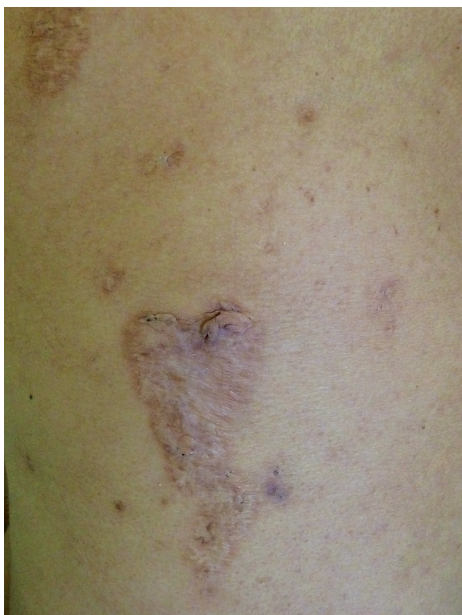
Obr. 5. Kribriformní jizvy po zhojeném pyoderma gangrenosum u pacientky s PASH

(obr. 5). Léčba zahrnuje kortikosteroidy (15–60 mg/den), anti-TNF biologika (infiximab, etanercept), zkouší se i anakinra, cyklosporin, thalidomid [9, 13].