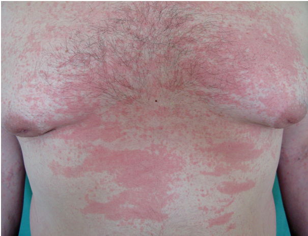
Obr. 4. Exantém při Stillově nemoci (z archivu prim. MUDr. Olgy Filipovské)

z lymfocytů, histiocytů a neutrofilů, při imunofluorescenci IgM uloženy v papilách koria a podél bazální membrány (obr. 3).