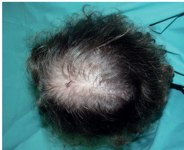
Obr. 4. FPHL – stupeň II podle Ludwiga

FPHL může být asociován s kožními známkami nadbytku androgenů, včetně hirsutismu a akné, i se systémovými známkami virilizace, jako jsou nepravidelnosti menstruace a infertilita [6]. U těchto žen je často pozorován mužský typ plešatění (hluboká, bitemporální recese) a řídnutí vlasů se může zlepšit po zahájení terapie antiandrogeny [5, 15], což poskytuje důkaz o androgen-dependentní povaze tohoto stavu. Ženy s typickou FPHL