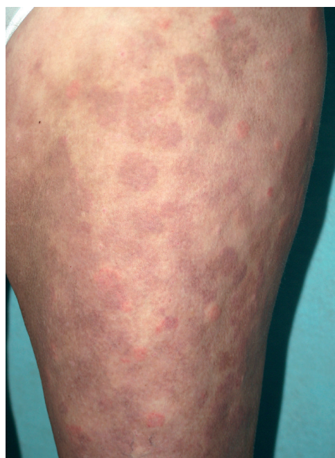
Obr. 1. Urtikariální vaskulitida

Mimo zmíněné se do této zvláštní skupiny kopřivkových syndromů řadí též Gleichův syndrom (epizodický angioedém s eozinofilií) a Wellsův syndrom (granulomatózní dermatitida s eozinofilií), urticaria pigmentosa, cvičením (námahou) indukovaná anafylaxe a konečně i klasická urtikariální vaskulitida . Histologicky se jedná o leukocytoklastickou vaskulitidu (leukocytární infiltrát s rozpadajícím se jádrem, fibrinoidní nekróza cévní stěny), kopřivkové projevy trvají déle než 24 hodin, spíše pálí než svědí, často má hemoragický charakter, může zanechávat pozánětlivé erytémy či pigmentace (obr. 1) a angioedém ji doprovází naprosto výjimečně. Může provázet systémový lupus erytematosus, Sjögrenův syndrom, kryoglobulinémií či hypokomplementémií.