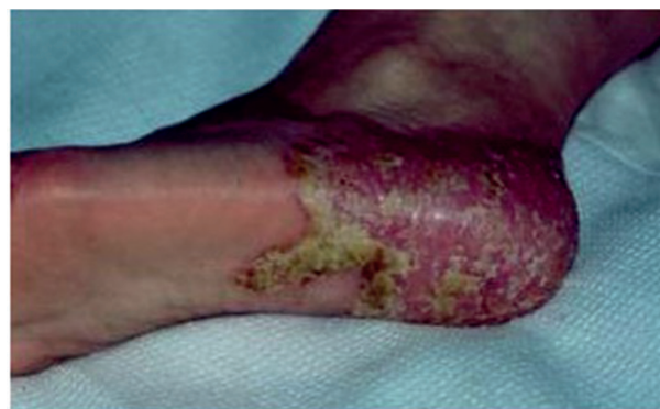
Obr. 4. Chronický erytém s deskvamací a ragádami u chronického průběhu PPP

tulózy, i když popisovány jsou i kožní projevy charakteru chronické ložiskové psoriázy nebo psoriaziformních exantémů. Podstata této vzácné komplikace není zatím přesně objasněna. Pravděpodobná je hypotéza, že náhlá a intenzivní blokáda TNF alfa vede k zesílení aktivity INF alfa s následnou indukci psoriázy [7, 22, 25].