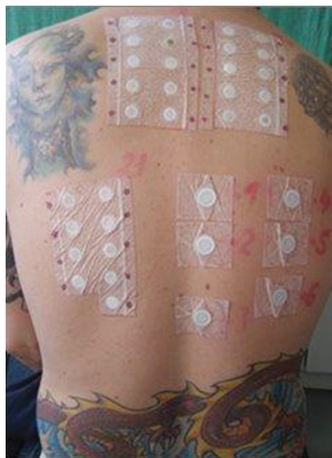
Obr. 1. Uzavřené epikutánní testy – evropská základní sada a atopické epikutánní testy