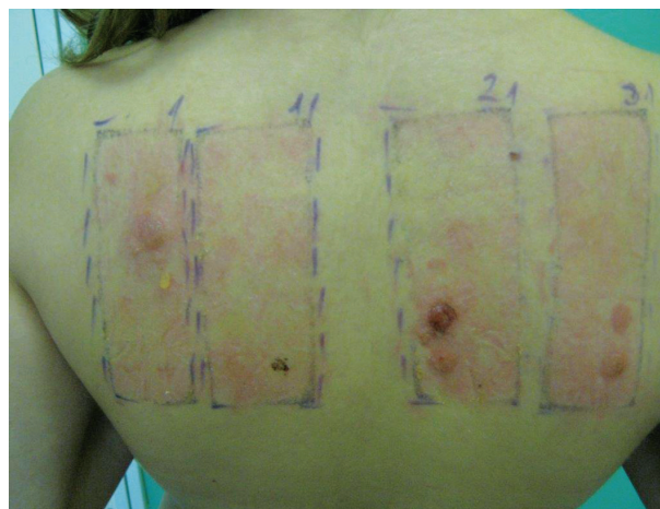
Obr. 11. Syndrom rozžhavaných zad