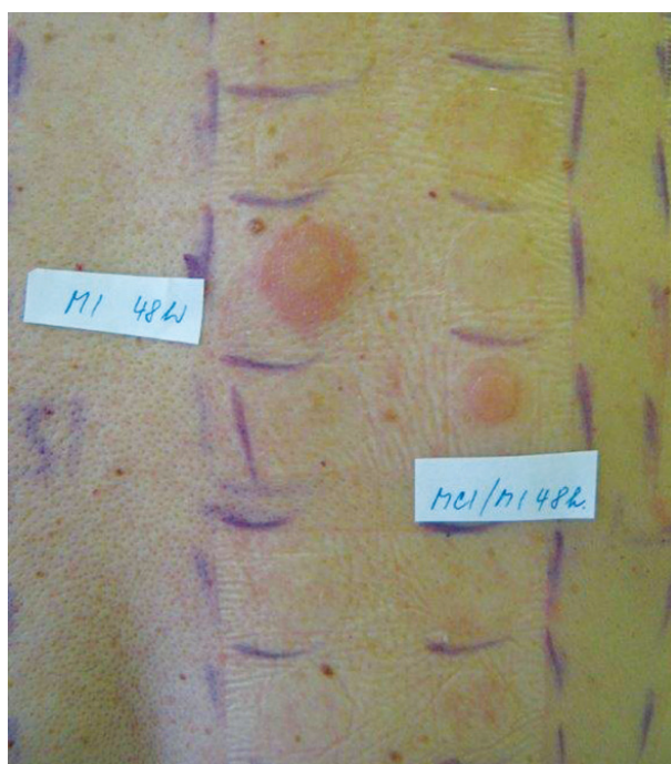
Obr. 15. Pozitivní epikutánní testy na isothiazolinony

barvy) a domácích přípravcích (přípravky na ošetřování kožených výrobků, aviváže apod.) limit není stanovený [2, 94]. Pryžové rukavice nechrání před penetrací MI [19]. Z malířských barev se uvolňuje řada týdnů (déle než 6 týdnů) a může být příčinou relapsů onemocnění [1, 49, 50]. MI byl nazván alergenem 21. století, alergenem roku 2013 v USA [91, 92] a KS na MI druhou epidemií na isothiazolinony [2, 23, 27, 78]. Kromě AKD ekzémového vzhledu (obr. 14, 15) vyvolává i kontaktní dermatitidu charakteru lymfomatoidní dermatitidy, vzhledu erytéma exsudativum multiforme, vyvolává airborne typ KD a systémovou KD (inhalací výparů) u senzibilizovaných osob včetně dětí, často zaměňovanou za recidivu atopické dermatitidy nebo lékový exantém [1, 39, 64, 97].