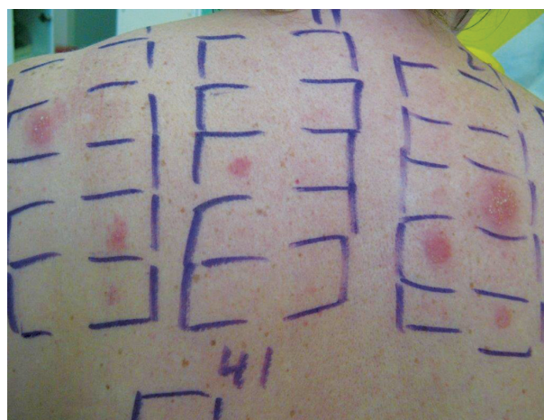
Obr. 12. Polyvalentní kontaktní senzibilizace