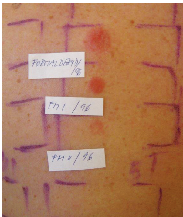
Obr. 5. Alergické reakce v epikutánních testech (sestupně +++ silná, ++ střední, + mírná intenzita)

Iritační reakce v ET mohou mít různou morfologii. Klasická iritační reakce má monomorfní vzhled, je ohraničená na místo aplikace a maxima dosahuje první odečítací den (D2). Během dalších hodnocení reakce zeslabuje (tzv. „decrecendo“ fenomén) nebo zcela vymizí. Příčinami bývají nevhodná koncentrace, zvýšená dráždivost kůže a další faktory. Některé iritační reakce mají charakteristický obraz: Mýdlový (šamponový) efekt (obr. 6) vyvolávají mýdla, mycí, čistící prostředky, detergenty a alkalické látky i v dostatečném ředění při prvním odečtu