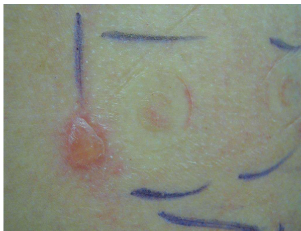
Obr. 10. Tahová reakce charakteru puchýře u okraje testovací náplasti

niklu, mědi, chromu, zlata) – obrázek 8. Může jít o zesílenou odpověď způsobenou chemotaxí neutrofilních leukocytů. Pustula může překrývat alergickou reakci, proto v nejasných případech je třeba testy zopakovat s nižší koncentrací alergenu [45, 66, 99].