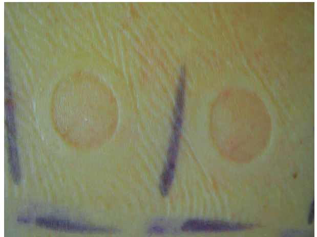
Obr. 9. Tlaková reakce po sejmutí testovacích náplastí