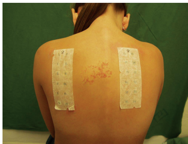
Obr. 2. Epikutánní testy T.R.U.E

Kromě EZS je možné si objednat speciální sady standardizovaných alergenů. K dispozici jsou sady zaměřené na určitou profesi (např. kadeřníci, obráběči kovů, pekaři apod.), na určité specifické podezříváné alergeny (např. sady lékové, sady zubních alergenů, kosmetických alergenů, chemikálií pryže, fotokontaktních alergenů apod.). K testování lze použít sady kontaktní alergenů od firem Chemotechnique Diagnostics ( www.chemotechnique.se ), AllergEASE ( www.smartpracticecanada.com ) nebo tzv. T.R.U.E testy ( www.smartpracticecanada.com ). T.R.U.E test (Thin-layer Rapid Use Epicutaneous test) je speciální testovací systém, u kterého je přesně stanovené množství alergenů (v miligramech na cm 2 ) vpravené