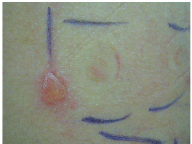
Obr. 10. Tahová reakce charakteru puchýře u okraje testovací náplasti

niklu, mědi, chromu, zlata) – obrázek 8. Může jít o zesílenou odpověď způsobenou chemotaxí neutrofilních leukocytů. Pustula může překrývat alergickou reakci, proto v nejasných případech je třeba testy zopakovat s nižší koncentrací alergenu [45, 66, 99].