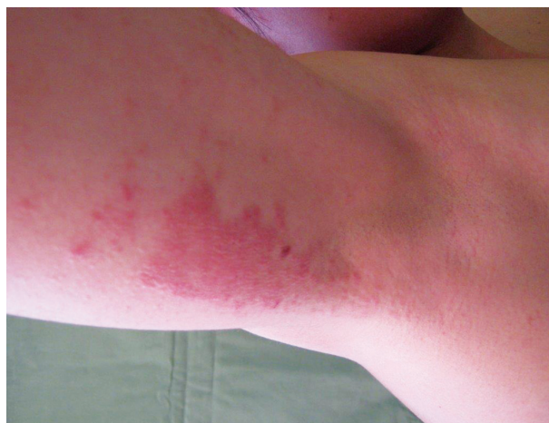
Obr. 14. Alergická kontaktní dermatitida na isothiazolinony v deodorantu

Isothiazolinony jsou organické sloučeniny, které se pro své baktericidní a fungicidní vlastnosti používají jako konzervační látky. V EU byly povolené 2 biocidy pro použití v kosmetice, methylchloroisothiazolinon (MCI) a methylisothiazolinon (MI). Směs MCI/MI v poměru 3 : 1 (Kathon CG) byla zavedená v 80. letech 20. století a široce se používala jako účinný širokospektrý konzervační prostředek [10]. To vedlo k epidemii AKD v Evropě, zjištěná KS se pohybovala mezi 3–8 % [35]. Došlo proto k postupnému snižování povolené koncentrace v kosmetických přípravcích (ze 100 ppm na 15 ppm) a od 16. dubna 2016 je použití MCI/MI v kosmetických přípravcích typu „leave-on“ zcela zakázáno [2]. V průmyslových kapalinách (např. lepidla, detergenty, oleje, malířské barvy, apod.) se stále používá v koncentracích mezi 15–50 ppm [36]. Pro nárůst KS na směs MCI/MI se od roku 2005 začal používat v kosmetických a průmyslových přípravcích výhradně nehalogenovaný derivát MI, jehož konzervační vlastnosti jsou nižší. Používané koncentrace proto byly vyšší než 100 ppm, a to ve všech typech kosmetických výrobků a řadě průmyslových výrobků [92]. Předpokládalo se, že se jedná o bezpečnou koncentraci [24]. S masivním používáním celosvětově prudce stoupla KS na MI [5]. Aktuálně je koncentrace ve všech kosmetických přípravcích omezená na 100 ppm, v průmyslových výrobcích (např. malířské