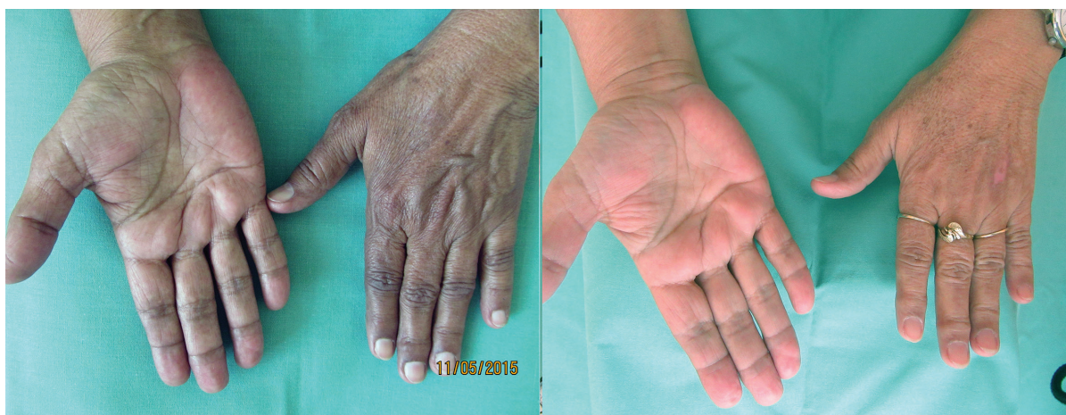
Obr. 4a, b. Před terapií (a) a po osmi měsících terapie (b)

závažný stav – addisonskou krizi – vyvolanou infektem močových cest. Vzhledem k již známé základní diagnóze byla pacientka standardně zaléčena přechodným zvýšením dávek hydrokortizonu podávaných parenterálně a antibiotiky.