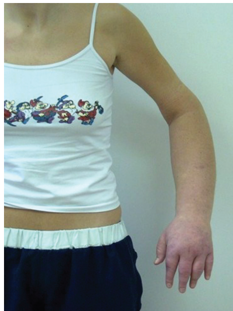
Obr. 4a). Otok levé horní končetiny způsobený jejím zaškracením

Pacientka ve věku 27 let byla odeslána k hospitalizaci na kožní oddělení pro otoky levé dolní končetiny k vyloučení poruchy lymfatické drenáže. V předchozích dvou letech byla opakovaně hospitalizována pro ataky dušnosti, horeček a polymorfní potíže v mnoha nemocnicích po celém kraji. Udávala polyvalentní alergii, užívala čtyři druhy bronchodilancií, dále methylprednisolon, zolpidem (hypnotikum), mirtazapin, escitalopram (antidepresiva) a řadu dalších medikamentů zahrnujících různé doplňky stravy, vazodilatancia, analgetika. V minulosti bylo vysloveno podezření na Münchhausenův syndrom