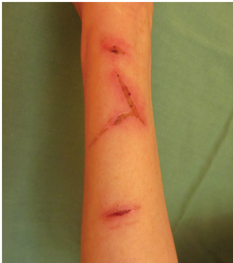
Obr. 1a) Lineární exkoriace na předloktí