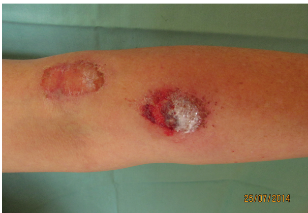
Obr. 1b) U levé loketní jamky kruhová eroze s fibrinovým povlakem, vedle hojící se eroze

nasazen hydroxyzin pro antipruriginózní a anxiolytický efekt. Pacientka byla po krátké hospitalizaci propuštěna, na plánovanou kontrolu nepřišla. V následujících letech se vždy s téměř ročními odstupy dostavovala s polymorfními stesky, kožní nález byl obdobný jako při hospitalizaci. V mezidobí byla vyšetřena na psychiatrii, nálezy s sebou nepřinesla. Podle jejího vyjádření ji tam „zničily prášky“. Při poslední dermatologické kontrole v roce 2014 byla pacientka v invalidním důchodu z psychiatrické indikace. Na předloktích se nacházely lineární exkoriace (obr. 1a), u levého lokte a na pravém nártu okrouhlé erodované plochy s fibrinovým povlakem (obr. 1b). Dále byly přítomny drobnější exkoriované plochy různého stáří na pravém stehně a bérkách. Léze byly zjevně způsobené arteficiálně. Od ošetřujícího psychiatra bylo zjištěno, že je pacientka léčena pro histrionskou poruchu a trvalou poruchu s bludy. Nedodržovala stanovenou léčbu – midazolam (hypnotikum), olanzapin, quetiapin (antipsychotika) a mirtazapin (antidepresivum). Pacientka špatně spolupracovala, nedocházela na kontroly, hospitalizaci na psychiatrickém oddělení opakovaně odmítla. Dva roky od prvního vyšetření spáchala sebevraždu skokem pod vlak.