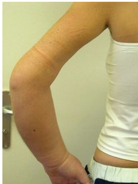
Obr. 4b). Strangulační rýha na levé paži

v souvislosti s jednou z opakovaných hospitalizací na infekčním oddělení, při které byla zachycena výrazná diskrepance v hodnotách tělesné teploty na různých místech těla a velké výkyvy teploty během krátké doby (za hodinu z 39 °C na 36,5 °C). Pacientka byla léčena ambulantně i ústavně na psychiatrii pro poruchy osobnosti a deprese, měla problémy v rodinných vztazích. Na dermatologickém oddělení byla ordinována kompresivní terapie, pacientka byla zvýšeně sledována, zaškrcování se však nepodařilo prokázat. Došlo k rychlé úpravě stavu a propuštění do domácí péče. O tři měsíce později byla pacientka hospitalizována znovu, tentokrát pro otok levé