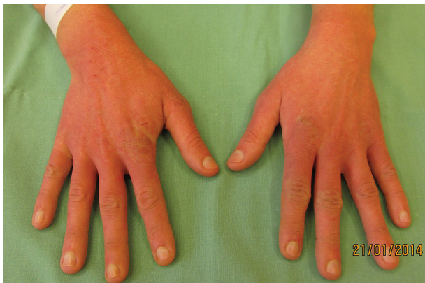
Obr. 3. Rukavicové postižení rukou, erytém až purpurový nádech kůže

noc (antipsychotikum). Pacient nejdříve odmítal hospitalizaci, jako důvod udával strach z nárůzy. Pro tuto obavu si umýval ruce několikrát denně, často myl i další části těla. Objektivně bylo přítomno rukavicové postižení rukou (obr. 3), erytém, lichenifikace a xeróza kůže na hřbetech rukou a dlaních, drobné ragády. Během hospitalizace bylo provedeno psychiatrické vyšetření se závěrem obsedantně-kompulzivní porucha. Výsledky epikutánních testů (Standardní evropská sada) a test alkalirezistence byly negativní. Byla navýšena dávka fluvoxaminu (150 mg/den), lokálně byl léčen steroidními externy a emolencií. Omezení frekvence mytí rukou bylo za hospitalizace dosaženo krytím obvazy. Pacient byl předán do péče spádového psychiatra, nespolupracoval, neužíval léky podle doporučení, několikrát odmítl hospitalizaci na psychiatrickém oddělení (jedním z udaných důvodů bylo, že musí vyřešit nakaženou oblast konečníku, kterou si několikrát denně drhne kartáčkem, současně došlo ke zhoršení stavu rukou). Po opakovaných intervencích rodiny a psychiatra však nakonec s hospitalizací souhlasil, v nemocnici bylo dohlédnuto na dodržování farmakoterapie a po její úpravě se stav pacienta výrazně zlepšil. V důsledku omezení mytí rukou se zlepšil i kožní nález. V současnosti užívá kombinaci antipsychotik ziprasidonu (20 mg/den), risperidonu (2 mg/den) a antidepresiv clomipraminu (50 mg/den) a sertralínu s postupným snižováním (nyní 50 mg/den).