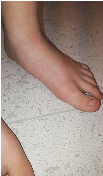
Obr. 5. Planovalgózní postavení nohou

2 x 3 cm na obou bérkách (obr. 3, 4). Na pravém bérce ventrálně byla přítomna poloměsíčitá jizva velikosti cca 4 cm. Nad pravým zevním kotníkem měl okrouhlé ložisko hyperpigmentace velikosti asi 2 x 2 cm, pedes plani, vadné držení těla (obr. 5, 6).