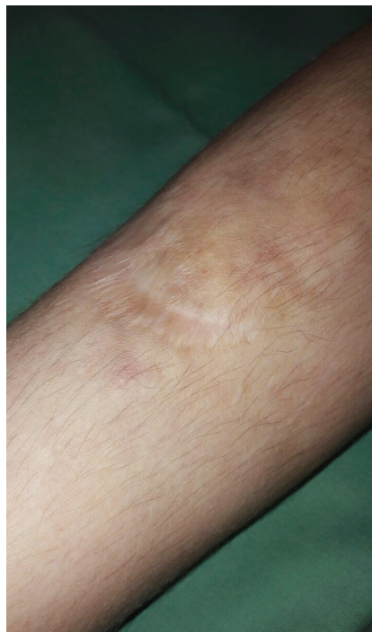
Obr. 4. Atrofické rozeklané jizvy a hematomy na bérce

V kojeneckém věku byl pacient hospitalizován pro neprosplivání. Ve 4 letech měl frakturu pravé klavikuly a v 5 letech si způsobil tržnou ránu na bérce vyžadující suturu, která se zhojila rozeklanou atrofickou jizvou. U pacienta byly typické známky klasické formy Ehlersova-Danlosova syndromu. Jemná, hebká kůže s nadměrnou kožní řasou, těstovité podkoží, hyperflexibilita kloubů, pozitivní příznak palce (obr. 1, 2). Na čele měl jizvy charakteru cigaretového papíru, na bérkách byla patrna atrofická kůže v místě resorbujících se hematomů, hematomy průměru