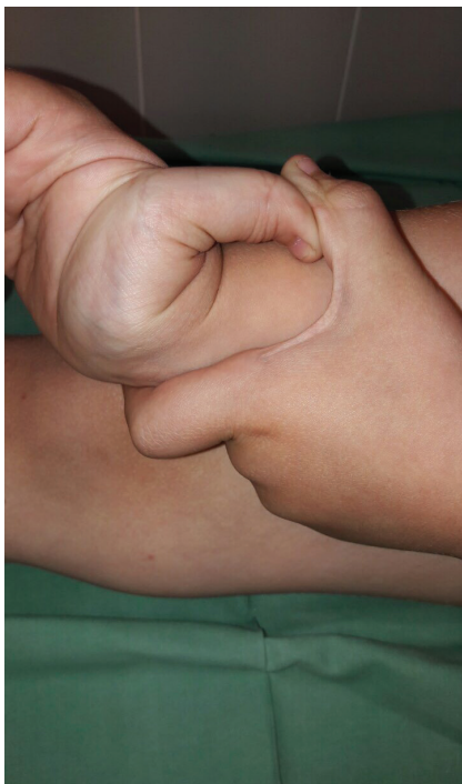
Obr. 1. Pozitivní příznak palce

ditě u matky došlo od 6. týdne k opakovanému krvácení z rodidel, pro hrozící předčasný porod byla hospitalizována. Porod proběhl ve 38. týdnu gravidity spontánně záhlavím, porodní hmotnost byla 3 200g a délka 50 cm. Poporodní adaptace novorozence byla v normě. Pro výrazné krvácení během porodu byla matce podána transfuze. Matka pacienta měla typické znaky Ehlersova-Danlosova