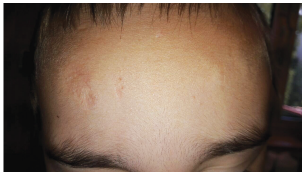
Obr. 3. Jizva charakteru cigaretového papíru na čele

syndromu – těstovité podkoží, rozeklané jizvy, hematomy na bérkách, hyperelasticitu kůže, hyperflexibilitu kloubů, kyfoskoliózu, chronickou žilní insuficienci.