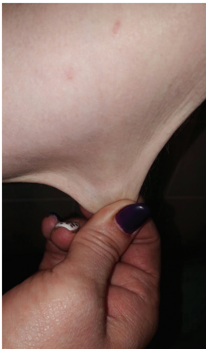
Obr. 2. Velká kožní řasa

ditě u matky došlo od 6. týdne k opakovanému krvácení z rodidel, pro hrozící předčasný porod byla hospitalizována. Porod proběhl ve 38. týdnu gravidity spontánně záhlavím, porodní hmotnost byla 3 200g a délka 50 cm. Poporodní adaptace novorozence byla v normě. Pro výrazné krvácení během porodu byla matce podána transfuze. Matka pacienta měla typické znaky Ehlersova-Danlosova