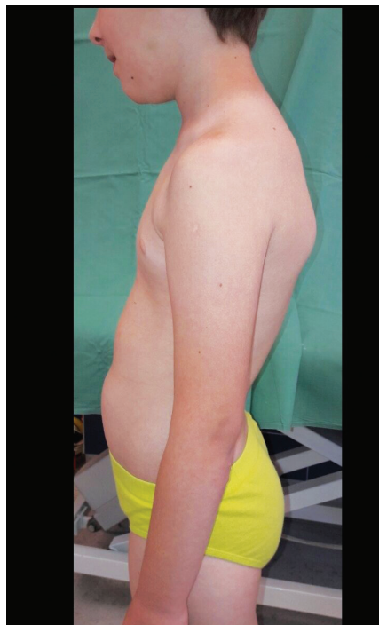
Obr. 6. Vadné držení těla

Pacientovi byl odebrán vzorek kůže k histologickému vyšetření. Ultrastrukturální obraz prokázal nález kompatibilní s Ehlers-Danlos syndromem. U kolagenních