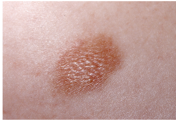
Obr. 3. Mastocytom s naznačenou vezikulací

Je zřídka formou kožního postižení, objevuje se zejména u dospělých. Projevy mají vzhled červených až hnědých teleangiektatických makul. Bývají distribuované symetricky na trupu a končetinách, vynechávají ob-