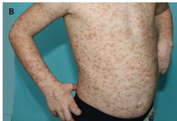
Obr. 4. Čtyřletý chlapec s projevy od čtyř měsíců věku