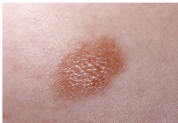
Obr. 3. Mastocytom s naznačenou vezikulací

Je druhým nejčastějším kožním projevem mastocytózy. Většinou se jedná o solitární žlutohnědý/červenohnědé ložisko či nodulus, často má povrch charakteru pomerančové kůže. Pokud je plochý, může připomínat modřinu. Projev je přítomen už při narození, nebo se objeví v prvních měsících života. Zřídka se popisují i mnohočetné mastocytomy. Často se vyskytuje na trupu a hýždích, méně často na končetinách a hlavě, málokdy je ve dlaních a na ploskách. Asi v polovině případů se v něm tvoří puchýře, spontánně nebo často po mechanickém dráždění (obr. 3). Flush je popisován asi u 30 % případů. Edém v místě projevu může být příčinou diagnostických potíží např. na víčku [7]. Do puberty dochází ke spontánní regresi bez jizvení.