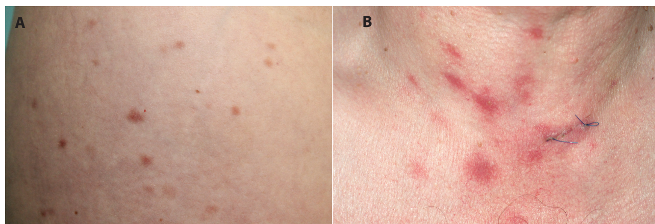
Obr. 2. Urticaria pigmentosa

a) Červenohnědé makulopapuly o velikosti několika mm