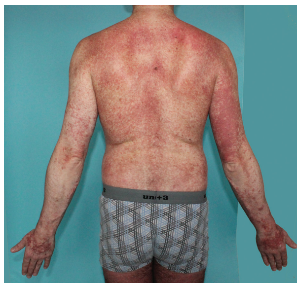
Obr. 5. Pacient s projevy od 36 let. Mediátorové příznaky nemá, splňuje diagnostická kritéria pro systémovou mastocytózu – indolentní formu, potvrzena mutace c-kit D816V, t. č. bez mediátorových příznaků, bez léčby, pouze pravidelně sledován na hematologii

Dětská mastocytóza často regreduje do puberty, více než u 60 % případů dochází k úplné regresi, u 20 % ke zmírnění projevů. Difuzní kožní mastocytóza může být spojena se závažnými mediátorovými projevy a komplikacemi, ale i v těchto případech často dochází k redukci kožního postižení