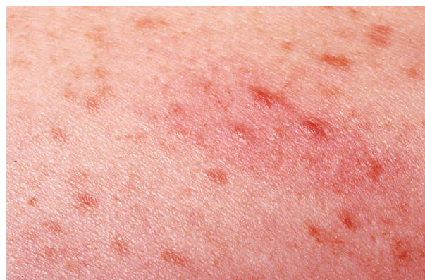
Obr. 1. Dariérův příznak – zduření projevů a erytém

Je nejčastější kožní manifestací onemocnění u dětí i dospělých (50–75 %). Makuly a papuly jsou velikosti několik milimetrů až centimetrů (obr. 2B), červenohnědé barvy. Mohou být přítomny na celém těle, většinou s vynecháním dlaní a chodidel. Objevují se v počtu desítek až stovek, někdy jsou dokonce splývající. Vysévají se často v průběhu několika měsíců, méně často přibývají léta. Mohou mít purpurický charakter, někdy se tvoří puchýře