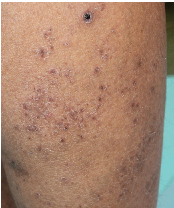
Obr. 2. Papuly, místy s centrální nekrózou na lýtku

tkání. Následně je imunopatologická reakce typu III u pacientů se silnou imunitou nahrazena reakcí buněčného pozdního typu IV se vznikem klasického granulomatózního zánětu. Část autorů s touto teorií nesouhlasí, histologicky se často postrádají známky leukocytoklastické vaskulitidy a vznik primárních lézí považují za následek subakutní lymfohistiocytární vaskulitidy, která vede ke vzniku drobných mikrotrombů s ischemickou nekrózou tkáně [22].