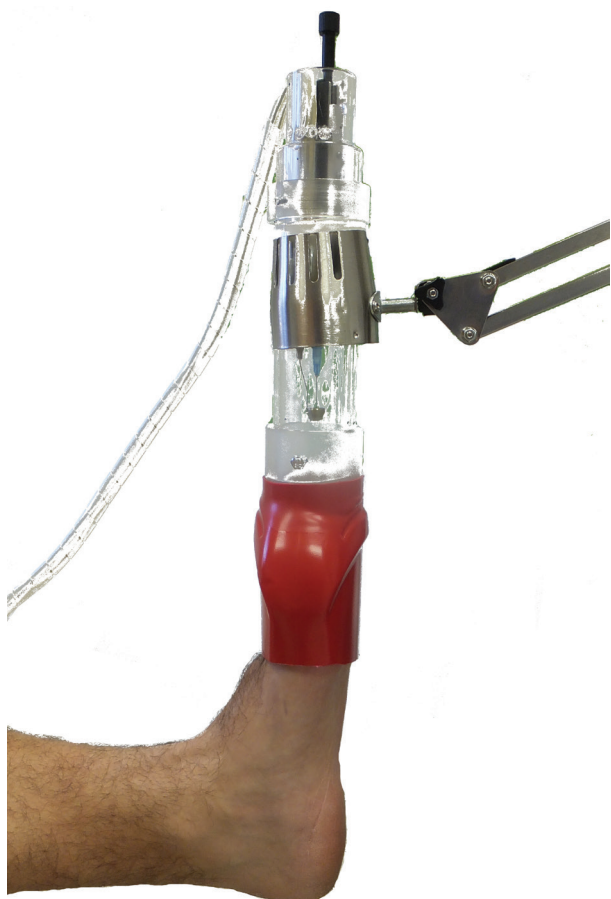
Obr. 2. Fotografie přístroje při expozici postižené končetiny nízkoteplotním plazmatem Zdroj plazmatu, schematicky znázorněný na obrázku 1, je uzavřen v plexisklovém pouzdře a upevněn v teleskopickém držáku. Prsty exponované nohy jsou uzavřeny v plastovém obalu.

benhamiae ) a Nannizzia gypsea byl kompletně inaktivován jen jeden ze tří testovaných kmenů. Podrobněji uvádějí výsledky těchto in vitro studií Soušková et al. [23, 25] a Scholtz et al. [18].