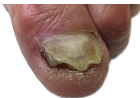
Obr. 4a. Nehty dolní končetiny před aplikací NTP: postižení nehtové ploténky v celém rozsahu, volný okraj nehtu nerovný, se známkami hyperkeratózy a drolení, na mediální straně nehtové ploténky se vyskytují známky rozštěpu a zarůstání.