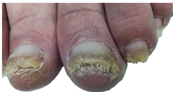
Obr. 3a. Palce obou dolních končetin před aplikací NTP: hyperkeratóza distálních částí nehtových plotének s drolením, zdravá proximální část ploténky cca 3–4 mm. Nehtové ploténky ostatních prstů distálně rovněž postiženy onychomykózou v různém rozsahu.

V říjnu 2016 bylo mikroskopické vyšetření vzorku nehtů pozitivní na dermatofytická vlákna, kultivačně byl identifikován původce T. interdigitale .