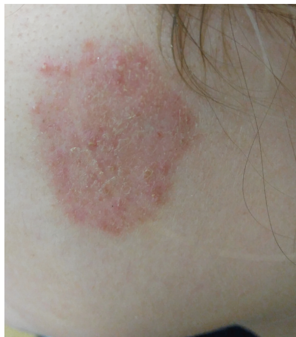
Obr. 1. Tinea faciei vyvolaná Trichophyton erinacei u pacientky 1 – oploštělé ložisko po devíti dnech lokální terapie ciklopiroxolaminem

Pacientka (žena, 19 let) se poprvé dostavila k lékaři dne 22. 12. 2016 s kožním ložiskem nacházejícím se