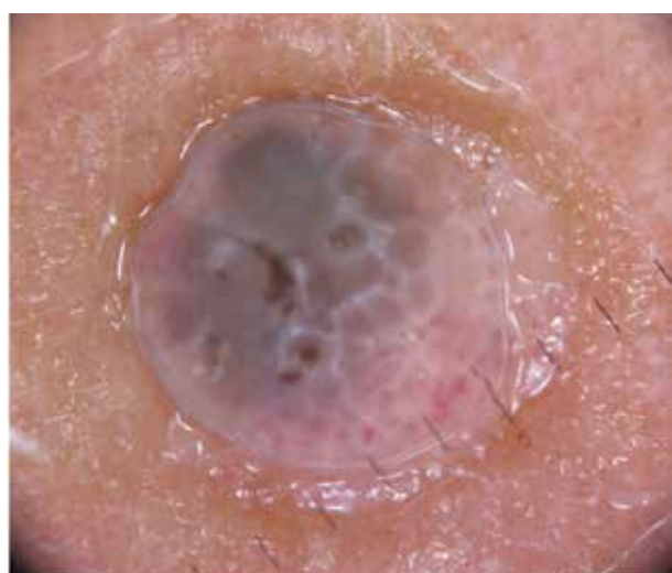
Obr. 2. Dermatoskopický náález

s angiektaziemi, bílá kontura připomínající inverzní pigmentovou síť, byl pozitivní wobble sign, okolní kůže nebyla změněna. Projev byl excidován a histologicky vyšetřen.