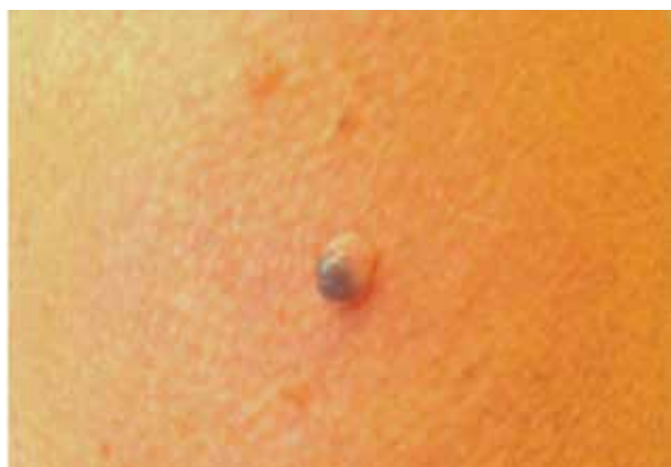
Obr. 1. Klinický obraz

Byly viditelné šedohnědé a bělavé až mléčně červené globule různé velikosti a intenzity zbarvení, na č. 5 a 6