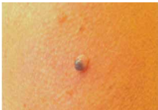
Obr. 1. Klinický obraz

Byly viditelné šedohnědé a bělavé až mléčně červené globule různé velikosti a intenzity zbarvení, na č. 5 a 6