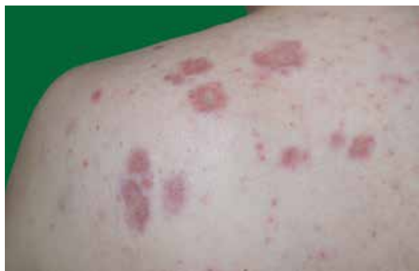
Obr. 3. HE 100krát – nekaseifikující dobře ohraničené „nahé“ sarkoidní granulomy v dermis a subcutis Fotografie publikována se souhlasem Ústavu klinické a molekulární patologie FN Olomouc.