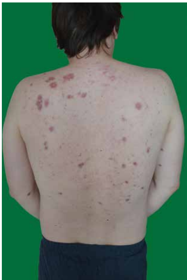
Obr. 1. Mnohočetné uzlovité infiltráty hnědočerveného zbarvení

V květnu 2016 byla cestou pneumologa zahájena systémová kortikoterapie prednisonem v úvodní dávce 40 mg/den s postupnou redukcí dávky při regresi plicního i kožního nálezu. Specifické laboratorní markery klesly do mezí normy. Spirometrické vyšetření prokázalo výrazné zlepšení funkčních hodnot. V srpnu 2017 se podařilo navodit remisi onemocnění a systémová kortikosteroidní léčba byla ukončena. Při kontrolním plicním vyšetření v dubnu 2018 se však laboratorně opětovně objevila výrazná elevace výše uvedených specifických markerů a zhoršení hodnot spirometrického vyšetření. Na rentgenovém snímku hrudníku bylo patrné zvětšení obou plicních hilů. Stejně tak byla potvrzena progresse nálezu CT vyšetřením. Stav byl hodnocen jako první recidiva plicní sarkoidózy. Recidiva kožního postižení se neopakovala.