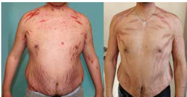
Obr. 4. Cushingoidní syndrom a mohutné striae indukované dlouhodobě podávanými kortikoidy, duben 2016 a při srovnání v listopadu 2018 po léčbě rituximabem

měsíců od zahájení terapie rituximabem, červenec 2017), bez terapie kortikosteroidy, jen s podpůrnou terapií osteoporózy (kalcium 500 mg/den a vitamínem D 400 IU/den, vitamín D 15 kapek 3krát týdně a bisfosfonáty – risedronát 35 mg 1krát týdně). Poslední dávka rituximabu byla podána před 17 měsíci v říjnu 2018. Pacient nadále dochází na pravidelné kontroly klinického stavu i laboratoře po dvou měsících.