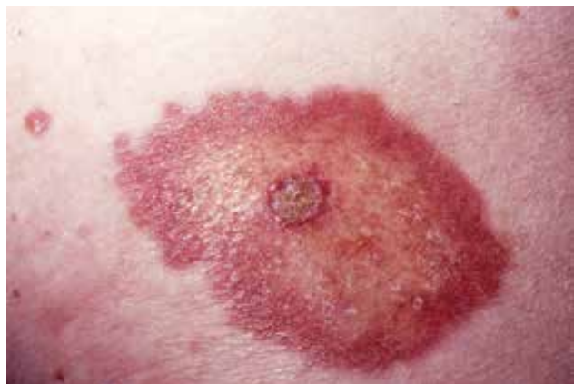
Obr. 1. Necrobiosis lipoidica s počínající ulcerací

Rodinný výskyt NL je vzácný. HLA asociace nebyla prokázána a nebyly prokázány rozdíly v HLA profilech diabetických pacientů s NL ve srovnání s profily diabetiků bez kožního postižení, průzkum se však týkal pouze diabetiků 1. typu [34]. Zajímavostí je případ jednovaječných dvojčat, žen, diabetiček 2. typu, u kterých se u obou vyvinula ložiska NL. U první ženy se kožní projevy objevily o pět let dříve než u druhé a jejich vznik předcházel onemocněním diabetem 2. typu, u druhé ženy byl naopak nejprve diagnostikován diabetes mellitus 2. typu a až po půl roce po stanovení této diagnózy se objevila kožní ložiska. Obě sestry měly ložiska NL lokalizovaná ventrálně na bérkách, histologické vyšetření dávalo obdobný výsledek, a v obou případech onemocnění nedostatečně reagovalo na lokální léčbu klobetasolem [37].