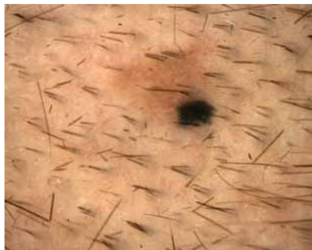
Obr. 1. Dermatoskopický obraz Světle hnědá symetrická léze s dlaždicím podobnými tmavšími okrsky a excentrickým šedočerným bezstrukturním ostrovem.

Pacientem je 38letý zdravý muž. Je dispenzarizován v dermatologické ambulanci po excizích dysplastických melanocytárních névů. V rodině se vyskytl povrchově