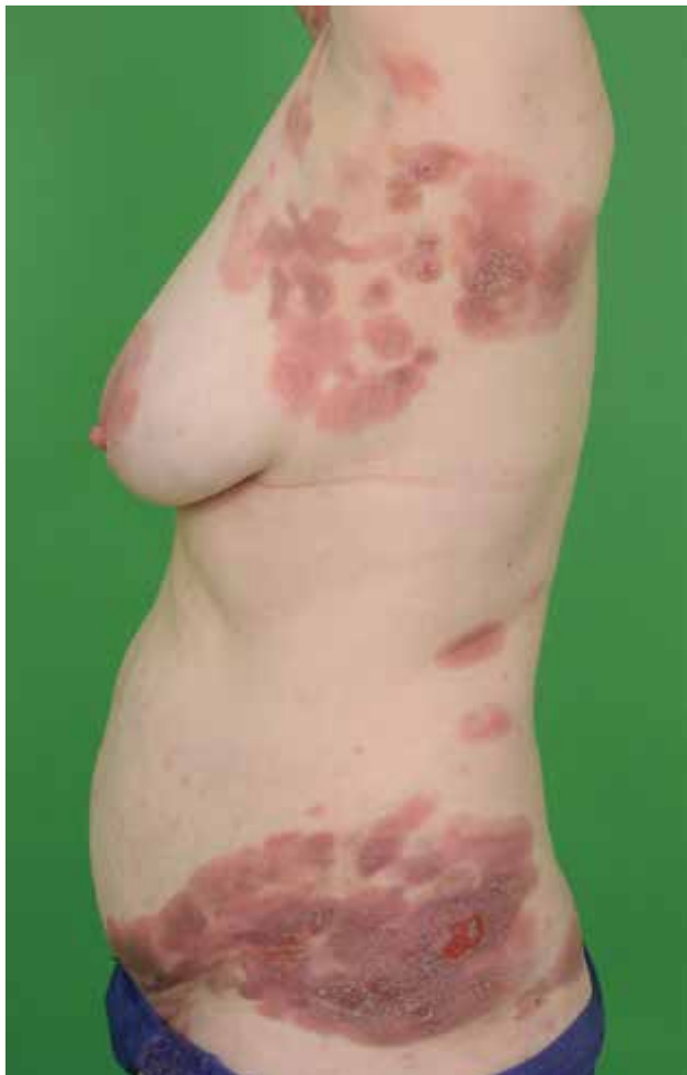
Obr. 2. MF – infiltrativní stadium (plaky)

vymizet a znovu se objevovat. Stadium makul/skvrn, pokud není léčeno, progreduje po několika letech do stadia infiltrativního. V infiltrativním stadiu (stadium plaků – plaque) se plak vyvíjí v místě jak původních projevů, tak i na dříve nepostížených partiích. Makroskopicky jde o ostře ohraničená infiltrovaná růžová až lividní ložiska různé velikosti, často anulárního či polycyklického („podkovovitého“) tvaru.