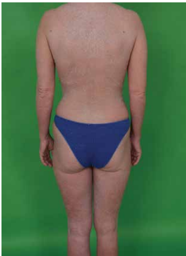
Obr. 7. Sézaryho syndrom

zivně svědí (obr. 7). Přítomná bývá alopecie, ektropion, onychodystrofie, hyperkeratózy dlaní a plosek s tvorbou ragád. V pokročilém stadiu mohou být postiženy vnitřní orgány, nejčastěji játra a slezina, nádorové buňky se však mohou šířit do jakéhokoliv orgánu, včetně kostní dřeně.