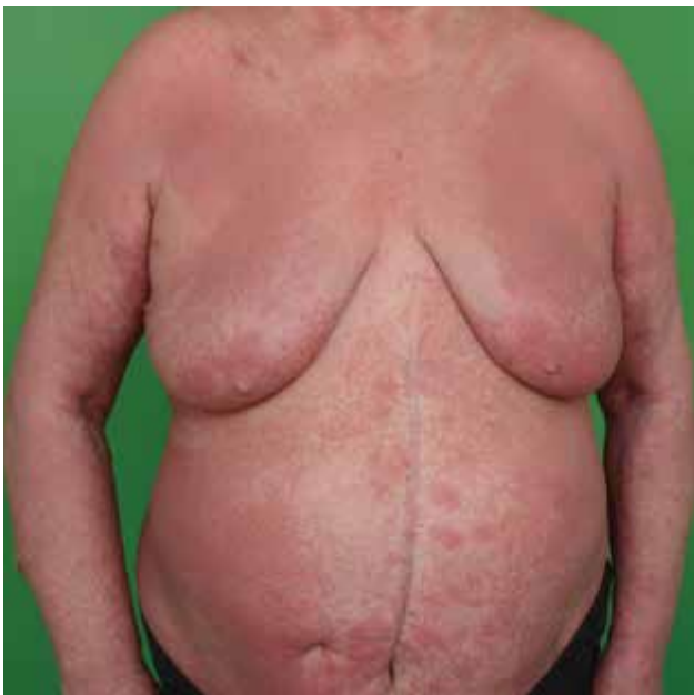
Obr. 4. MF – erythrodermie

erytematozními folikulárně vázanými papulami, akneiformními lézemi, indurovanými plaky a někdy i tumory (obr. 5). V oblasti kapilicia a očních řas vede k alopecii. Folikulotropní MF se histologicky vyznačuje charakteristickými infiltráty z neoplastických T lymfocytů váza-