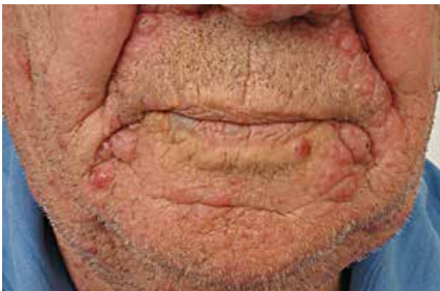
Obr. 5. MF – folikulotropní varianta