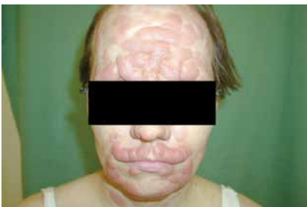
Obr. 6. MF – tumorózní stadium, facies leontina

ných na vlasové folikuly. Typickým znakem je akumulace mucinu ve vlasových folikulech, která však nemusí být patognomonická pro toto onemocnění. Prognóza je horší než u klasické MF, 5 let přežívá 70–80 % pacientů [8]. Léčebně je nutné volit razantnější metody než u konvenční MF, protože infiltrát je lokalizován hlouběji. Pagetoidní retikulóza (Woringerova-Koloppova) je lokalizovaná forma CTCL. Klinicky se manifestuje jako psoriaziformní nebo hyperkeratotické ložisko s typickou lokalizací na končetinách a pomalou progresí choroby. Na rozdíl od klasické MF nedochází u této varianty k mimokožnímu šíření onemocnění. Granulomatózní syndrom ochablé kůže (granulomatous slack skin – GSS) je vzácný podtyp MF charakterizovaný rozsáhlými ložisky, se ztenčelou ochablou kůží vytvářející převislé řasy s predilekcí v axilách a tříselech. U pacientů s GSS se může souběžně manifestovat Hodgkinova choroba [13]. Mezi méně časté klinické obrazy MF řadíme hypopigmentovaná či hyperpigmentovaná ložiska anebo ložiska poikilodermická – poikiloderma atrophicum vasculare (skvrnitá pigmentace, epidermální atrofie a teleangiektazie). Hypopigmentovaná ložiska jsou častější u dětí a u pacientů s tmavší kůží. Vzácně se také můžeme setkat s bulózními/vezikulózními lézemi (plihé nebo napjaté puchýře), purpurovými lézemi, ichtyosiformními projevy, facies leontina (obr. 6).