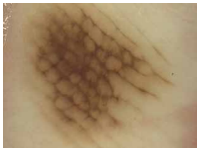
Obr. 4. Melanocytový névus „Lattice like pattern“ – lineární pigmentace ve žlábčích pospojovaná napříč do obrazu mříže.

Především melanocytové névy mohou mít schematicky celou řadu variant. Může jít o typ mřížkovitý („lattice like pattern“), fibrilární, homogenní, globulární, retikulární, atypický a řadu dalších [2, 3]. Typ mřížkovitý (obr. 4) je tvořen tenkými hnědými liniemi v sulci superficiales, které jsou na rozdíl od nejčastější varianty navíc navzájem pospojovány kratšími liniemi probíhajícími napříč. Dermatoskopický obraz tak připomíná mříž. Mřížkovitý typ je druhým nejčastějším nálezem u získaných melanocytových névů, v praxi se s ním setkáváme velmi často a je ukazatelem nezhoubného charakteru akrální melanocytové léze. Typ fibrilární (obr. 5) je tvořen velmi tenkými hnědými liniemi, které probíhají paralelně šikmo jak přes sulci superficiales, tak i přes cristae superficiales [2, 3]. Setkáváme se s ním při vyšetření melanocytových projevů na chodidlech v místech největší mechanické zátěže, kam je přenášena většina tělesné hmotnosti – tedy nejčastěji na patách a při zevním okraji chodidla. Ke vzniku tohoto vzorce pigmentace dochází díky posunu nejsvrchnějších vrstev epidermis (sešikmení stratum cor-