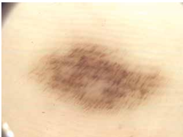
Obr. 5. Melanocytový névus atypický Fibrilární typ – tenké hnědé linie paralelně probíhající šikmo napříč sulci superficialis i cristae superficialis, pravidelné uspořádání.