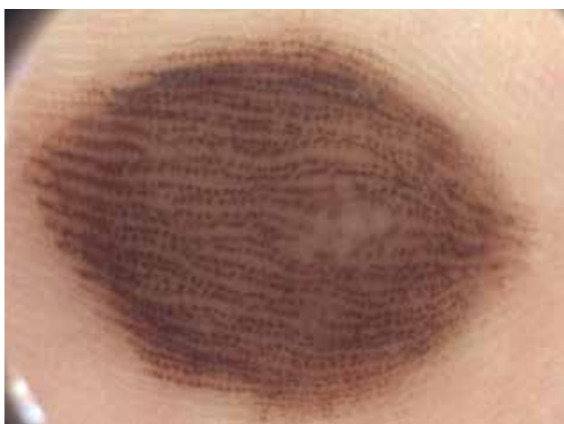
Obr. 6. Kongenitální melanocytový névus „Peas in a pod pattern“ – sulci superficialis jsou lemováni tenkými hnědými liniemi, mezi nimi jsou pigmentové tečky nebo menší globule.