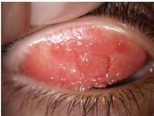
Obr. 4. Gigantopapilární reakce na horních tarzálních spojivkách při atopické keratokonjunktivitidě (konkrétně obr. 3)

Objektivně jsou víčka ztluštělá, zarudlá, intermitentně se objevují otoky. Později se objevuje deskvamace, lichenifikace, melanóza. Spojivky vykazují hyperemii, později i hypertrofii papil (obr. 4). Keratitida může progredovat až do vředu. Hojení je často provázeno jizvením a vaskularizací rohovky (obr. 5), což vede k trvalému poklesu zrakové ostrosti. Subjektivně postižení