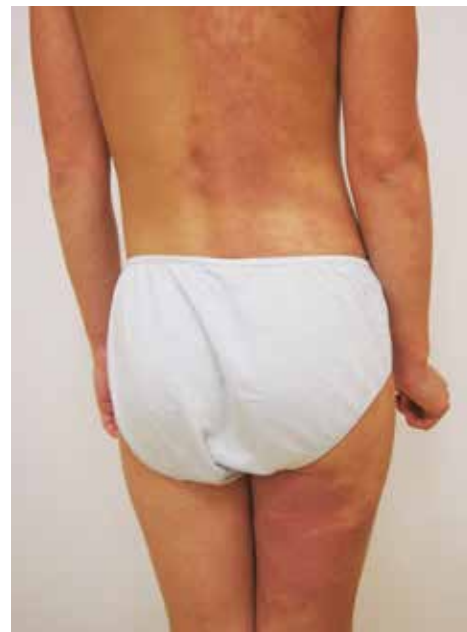
Obr. 8. V šesti letech věku