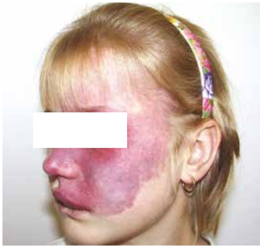
Obr. 12. Sturge-Weber syndrom

nežádoucí účinky dle SPC jsou gastrointestinální potíže (nevolnost, zvracení, průjem), snížená chuť k jídlu, zvýšená únava, kožní vyrážka, elevace kreatininu, lipázy, GGT, ALT, snížení lymfocytů, anemie.