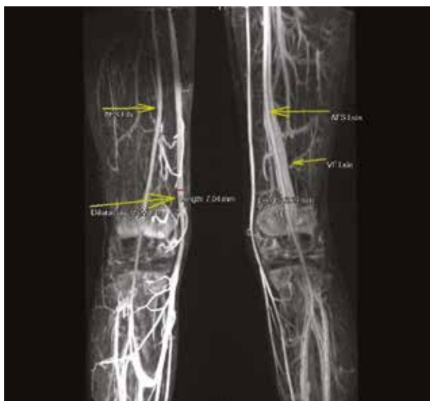
Obr. 9. MRA s nálezem dilatovaná VSM a chybějící VF a VP na PDK

pro rozsáhlý naevus flammeus, který byl přítomen od narození na kůži PDK a trupu. V provedených vyšetřeních (pediatrické, oční, genetické, sonografické včetně CNS a vnitřních orgánů) nebyla popsána žádná patologie. Pouze sonograficky byl na cévách PDK zmíněn nepřesně hodnotitelný nález, který předpokládal anatomické anomálie žilního systému, eventuálně A-V malformace.