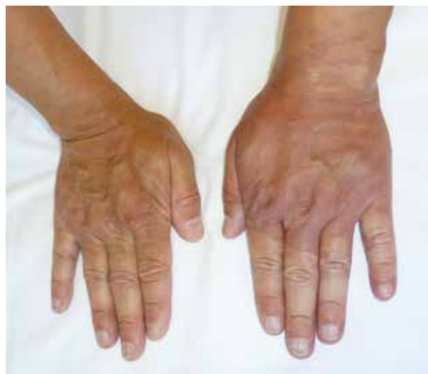
Obr. 5. Postižení levé ruky