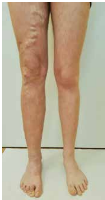
Obr. 1. Klinický nález KTS u pacienta z první kazuistiky

Devatenáctiletý jinak zdravý pacient byl odeslán na lymfologickou ambulanci s podezřením na lymfedém pravé dolní končetiny (PDK). Barevné změny na kůži PDK udával od narození, objemové změny několik let, ale v posledních 3 letech se „otok“ zhoršil a tehdy se také objevila křečová žíla na stehně. Fyzikálním vyšetřením jsme zjistili výrazný varix, PDK od kotníku do třísel byla silnější než LDK. Mapovitý světle růžový erytém v nivéau kůže byl přítomen v oblasti celé PDK od nártu až do pasu (obr. 1).