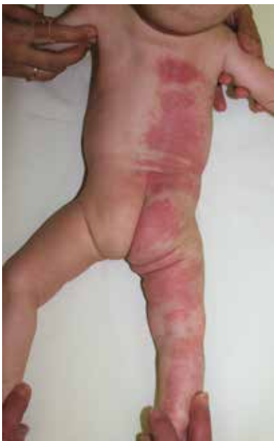
Obr. 6. Dívka z třetí kazuistiky ve čtyřech měsících