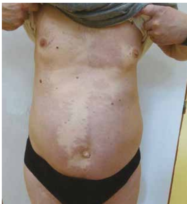
Obr. 4. Neobvykle rozsáhlá kapilární malformace u pacienta z druhé kazuistiky

Čtyřměsíční jinak zdravá holčička, narozená v termínu z fyziologické gravidity byla doporučena k vyšetření