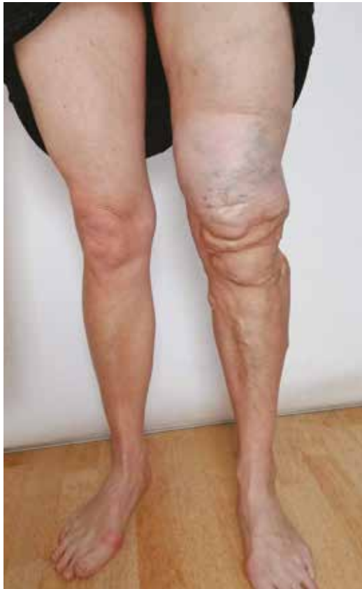
Obr. 10. Laterální marginální žíla na LDK

Rozdílné znaky kapilární malformace a povrchového hemangiomu jsou uvedeny v tabulce 2. V terénu naevus flammeus se vzácně mohou vyskytovat i hemangiomy, lymfangiomy, nebo angiokeratomy [1].