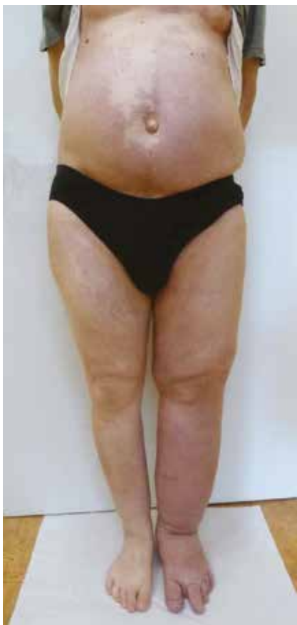
Obr. 3. Klinický nálezn KTS u pacienta z druhé kazuistiky

Na lymfoscintigrafickém vyšetření provedeném s aplikací lymfotropního radiofarmaka do podkoží v 1. a 3. meziprstí se povrchový mízní systém PDK spolehlivě