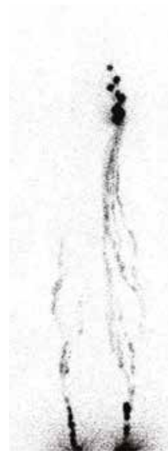
Obr. 2. Lymfoscintigrafický nález na DKK za klidových podmínek (KZM, FN Plzeň)