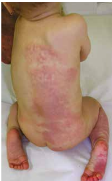
Obr. 7. Ve třinácti měsících