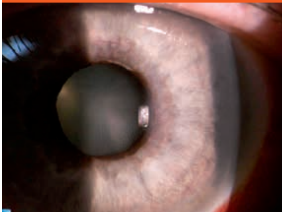
Obr. 3. Ektropium pigmentového listu dúhovky (archív II. Očnej kliniky SZU)

zrenice. Tieto nemusia byť pri vyšetrení štrbinovou lampou vo včasnom štádiu viditeľné. Pod vplyvom ďalšej koncentrácie VEGF dochádza ku vzniku fibrovaskulárnej membrány pokrývajúcej povrch dúhovky a rozširujúcej sa smerom do uhla, ktorého štruktúry prekrýva (obr. 2).