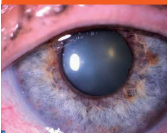
Obr. 1. Rubeóza dúhovky