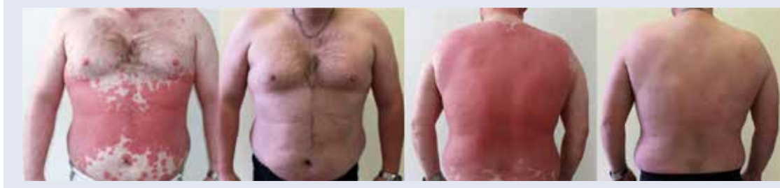
Obr. 2 | Pacient s metabolickým syndrómom s ťažkou formou psoriázy pred liečbou a po 3 mesiacoch liečby preparátom skupiny anti-TNF \alpha – adalimumabom