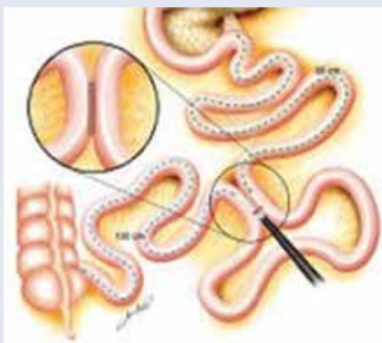
Obr. 4 | Parciálna jejunálna diverzia pomocou magnetických osemhranov. A – príprava k naloženiu magnetov B – endoskopický pohľad na jejúnoileálnu anastomózu. Upravené podľa [19]