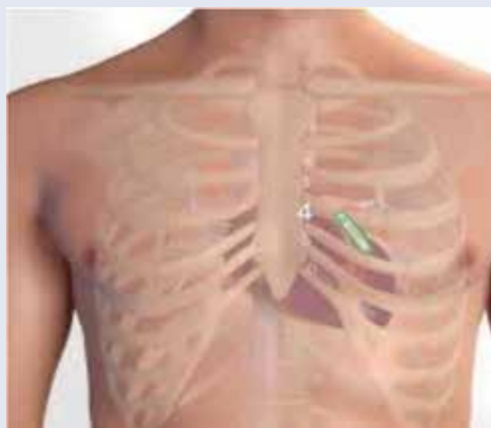
Obr. 1 | Umiestnenie implantovateľného slučkového záznamníka v prepektorálnej oblasti, parasternálne vľavo

Prvá implantácia ILR na svete sa uskutočnila v roku 1998. V tom čase batéria vydržala približne 14 mesiacov. Vývoj ILR však postupne napredoval, a to najmä v oblasti zdokonaľovania detekcie arytmií, predovšetkým algoritmov na detekciu P vln a atriálnych tachyarytmií, čo bolo v detekcii FA nevyhnutné. Rovnako žiadaná však bola aj postupná miniaturizácia prístrojov a dlhšia výdrž batérie. V starších modeloch predstavovala problém detekcia falošne pozitívnych nálezov a artefaktov, čo si vyžadovalo jej zdokonalenie. V súčasnosti máme v Slovenskej republike k dispozícii ILR od 3 firiem, v klinickej praxi sa však využívajú iba 2 (obr. 2). Súčasne dostupné modely Reveal LINQ a Confirm Rx sa okrem vyššie uvedených „vylepšení“ vyznačujú najmä simplifikovanou technikou implantácie. Ide o implanto-