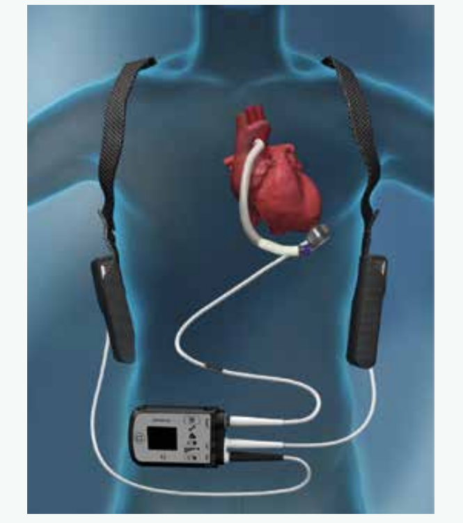
Obr | Mechanická srdeční podpora HeartMate 3