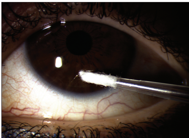
Obr. 1. Odběr PCR jednorázovou mikropipetou s otiskem v místě keratitidy