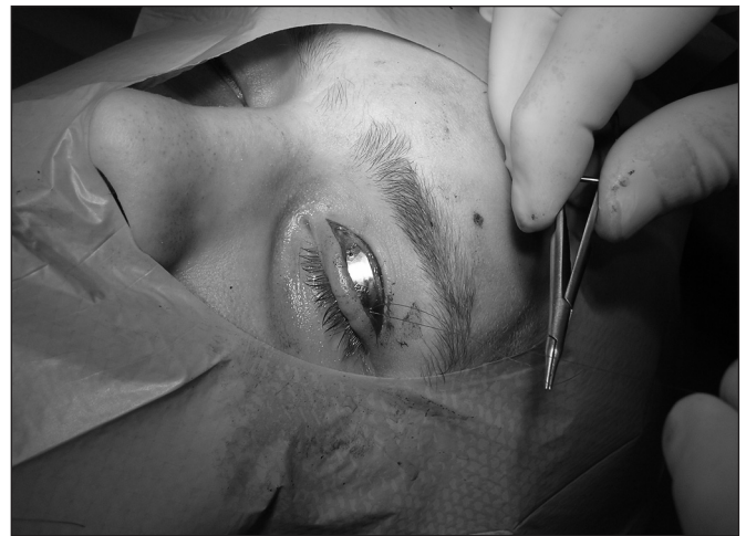
Obr. 8. Závěrečná pozice implantátu na horním víčku