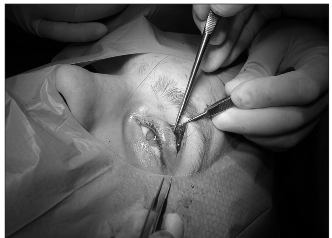
Obr. 9. Sutura podkoží