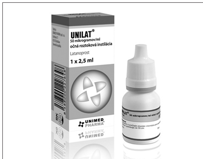
Obr. 1. Generický produkt UNILAT (latanoprost 50 \mu g/ml, očná roztoková instilácia, Unimed Pharma)

Odporúčané dávkovanie bola 1 kvapka do postihnutého oka/očí jedenkrát denne. Viaceré štúdie dokázali, že optimálny účinok sa dosiahne, ak sa latanoprost podáva večer [1, 7]. Odporúčaná doba podávania bola teda medzi 19.–21. hodinou