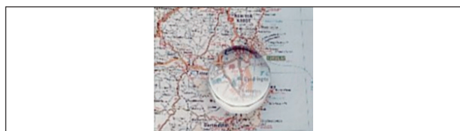
Obr. 7. Príložná lupa

Na základe analýzy získaných výsledkov sme zistovali a posudzovali efektívnosť predpisovania optických pomôcok na kompenzáciu ZP u detí.