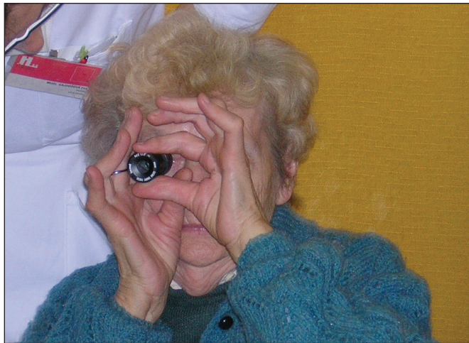
Obr. 1. Teleskop