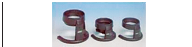
Obr. 10. Lupa stojanková – príložná, bez osvetlenia

Celkovo bolo predpísaných 171 optických pomôcok u 74 pacientov: 76 lúp – 44,4 %, 21 hyperokulárov alebo hyperkorekcií – 12,3 %, 65 teleskopov – 38 % a 9 príložných lúp k te-