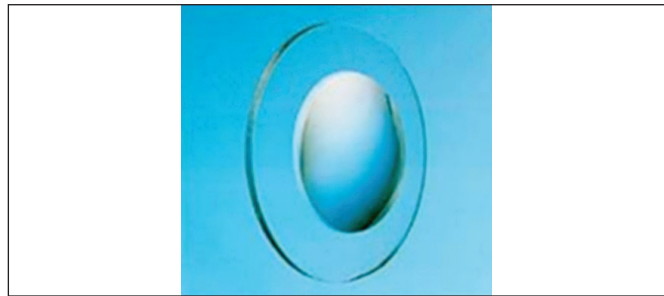
Obr. 4. Hyperokulár

podľa WHO a ICD-10 [9] v závislosti od binokulárnej ZO a duálnej klasifikácie príčin ZP podľa postihnutej anatomickej časti a podľa časového faktora, kedy k tomuto postihnutiu došlo tak ako navrhla Gilbertová [4]. Pri spracovaní sme použili metódy deskriptívnej štatistiky a párový t-test.