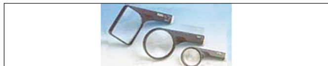
Obr. 6. Ručná lupa