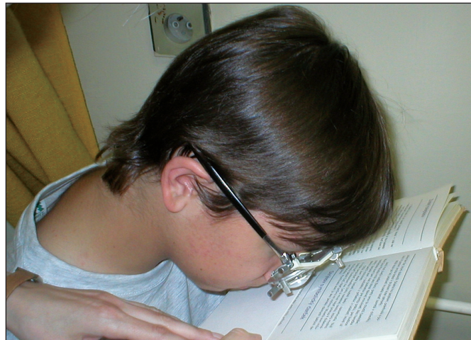
Obr. 5. Hyperokulár v skúšobnom ráme