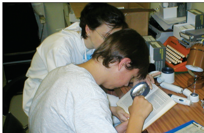
Obr. 11. Ručná lupa bez osvetlenia