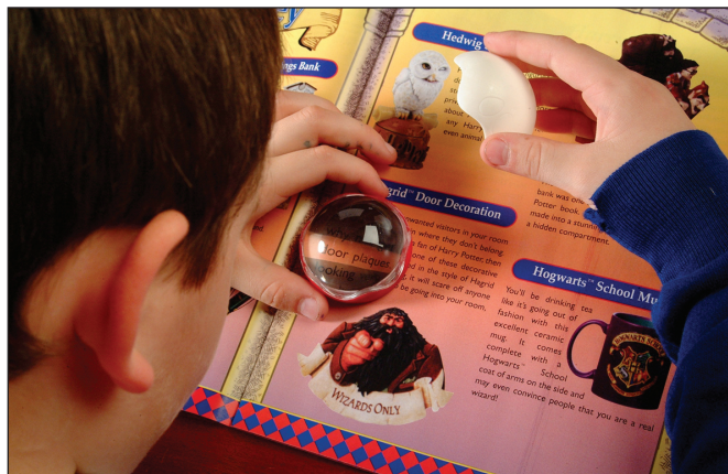
Obr. 8. Príložná lupa s riadkom