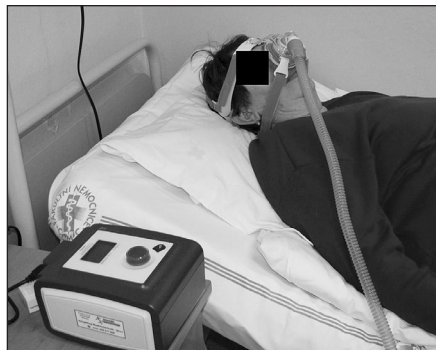
Obr. 8. Léčba OSAS kontinuálním přetlakovým dýcháním pomocí přístroje CPAP (continuous positive airways pressure)

Terapie je vždy komplexní. V první řadě jde o režimová opatření, kdy jedním z nejdůležitějších ovlivnitelných rizikových faktorů pro OSA je redukce hmotnosti. Následuje konzervativní terapie – nejčastěji přetlakové dýchání (CPAP – continuous positive airway