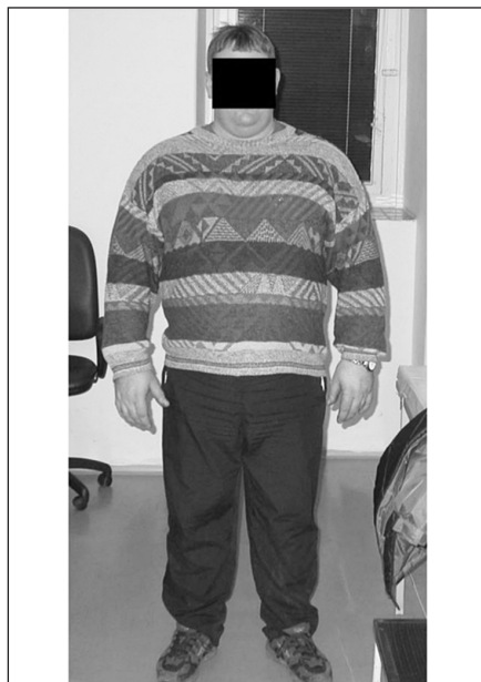
Obr. 6. Typická predispozice ukládání tuku v oblasti krku u obézního pacienta s OSA

deným výše, že FES bývá více akcentován na té straně, kterou pacient při spánku preferuje. Tuto skutečnost jsme několikrát zaznamenali i u našich pacientů (obr. 5).