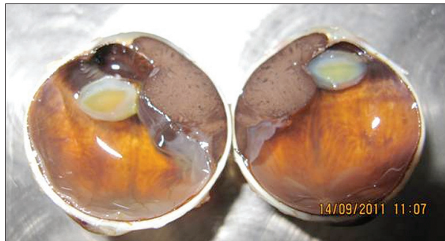
Obr. 1. Malígný melanóm corpus ciliare v štádiu T3N0M0 so sublúxiou šošovky a pre-rastaním do prednej očnej komory

Okrem veľkosti ovplyvňuje prognózu aj tvar nádoru (obr. 1). Za agresívnejšie sa považujú difúzne formy rastu MMU, a v prípade MM dúhovky a corpus ciliare tiež prstencový rast nádoru.