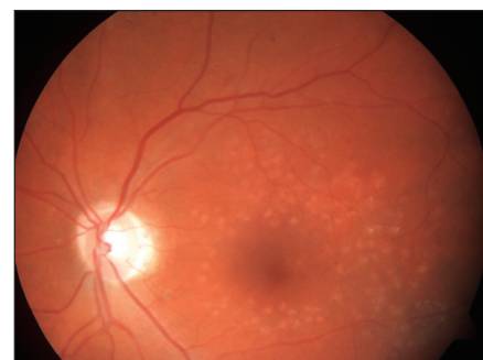
Obr. 4. Stav ½ roku po provedené fotokoagulaci – týž pacient jako na obr. 1

Studie prokázala lepší efekt ošetření DME laserem nežli intravitreální aplikací triamcinolonu při jeho menších vedlejších účincích. V extenzi studie DRCR.net bylo cílem porovnat účinnost fotokoagulace sítnice proti kombinované léčbě laserem s intravitreální aplikací triamcinolonu. V druhých dvou ramenech byla porovnávána účinnost intravitreální aplikace ranibizumabu (Lucentis, Genentech Inc., Novartis Pharma AG) v kombinaci s časnou a odloženou fotokoagulací sítnice laserem.