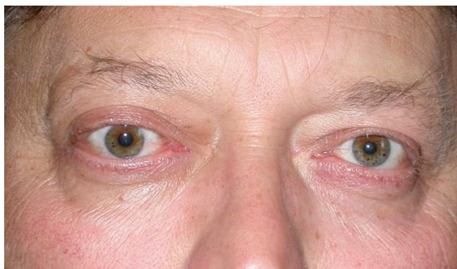
Obr. 6a, b Pacient s hypotropií pravého bulbu v důsledku restrikce dolního přímého svalu a rušivou diplopií (a). S prizmatickou korekcí je pacient bez diplopie v přímém pohledovém směru(b)