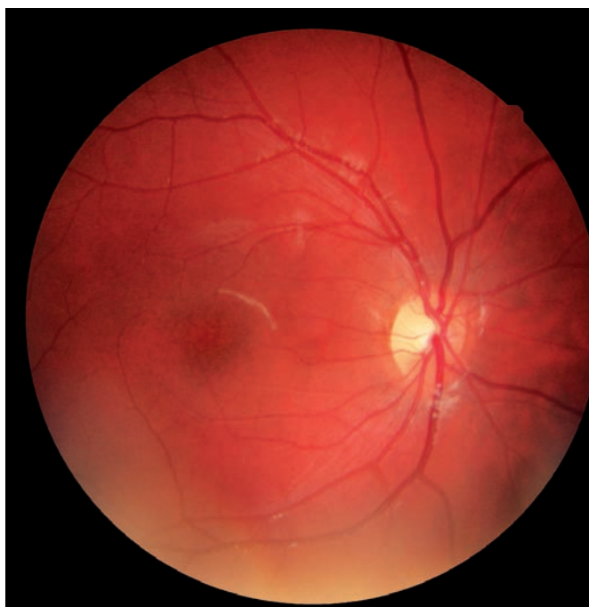
Obr. 1 a) Foto fundu pravého oka.

Dále doplněno přístrojové vyšetření barvocitu (HMC anomaloskop, Oculus), který byl oboustranně bez postižení. Multifokální elektroretinografie ukázala výrazné deprese potenciálů makulární oblasti bilaterálně s prodlouženou latencí vlny P, což potvrzuje atrofii v centrální krajině. Výsledek analýzy laserové skenovací polarimetrie (GDx) bilaterálně v mezích normy.