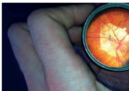
Obr. 4 Sítnice 24leté pacientky s myopickou degenerací zadního pólu levého oka před plánovanou operací strabismu.