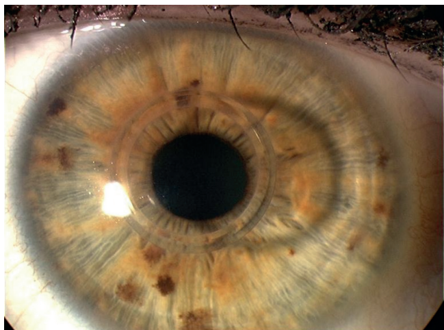
Obr. 1 Rohovka s implantovaným MyoRingem

GmbH, Austria) je alternativní technikou, kterou pro použití v korekci keratokonu popsal Daxer (6), (obr. 1). Kroužek je vyroben z polymethylmetakrylátu a je částečně flexibilní. Je dostupný v průměrech 5 a 6 mm, tloušťka prstence je 240, 280 a 320 \mu\text{m} . Typ kroužku je volen dle požadovaného efektu dle nomogramu doporučeného výrobcem (tab. 1). Kroužek je implantován do rohovkové kapsy průměru cca 9 mm, v hloubce 300 \mu\text{m} . Vstupní kanál do kapsy je umístěn zpravidla temporálně a jeho šířka je přibližně 4–5 mm, délka cca 2 mm. Intrastromální kapsu lze vytvořit pomocí speciálního mikrokeratomu, kdy řez je vytvořen vibrujícím diamantovým nožem po předchozím přísátí hlavy keratomu na rohovku pacienta (PocketMaker, Diopex GmbH, Austria). Jinou možností je použití femtosekundového laseru (1, 9). Hlavní výhodou Myoringu ve srovnání s rohovkovými segmenty je možnost pooperační úpravy polohy prstence a tím optimalizace efektu prstence (4, 10), jednoduchá manipulace a možnost kombinace s intrastromální aplikací riboflavinu při výkonu kombinovaném s CXL (5). Roční a dvouleté výsledky u skupiny pacientů s keratokonem a implantovaným MyoRingem jsou obsahem této práce.