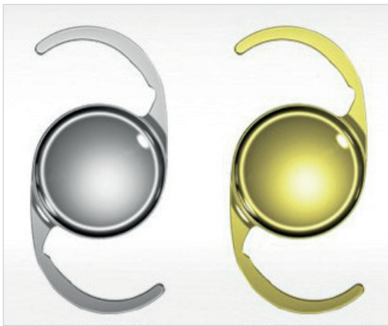
Obr. 1 Čočka CT LUCIA 601P(Y)