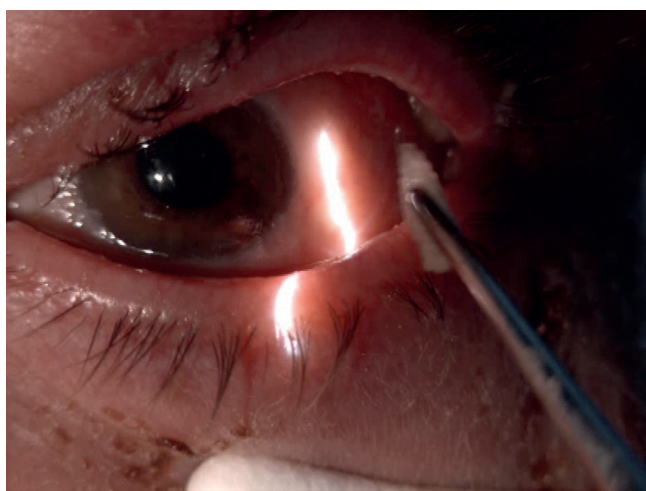
Obr. 3 Manuální vybavení larev v lokální anestezii