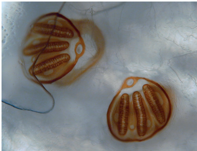
Obr. 5 Mikroskopický pohled na původce externí oční myiázy – larvu z čeledi Calliphoridae

ku pozdních komplikací byl nemocný ošetřen opět v našem zdravotnickém zařízení. V našem ani jiném zdravotnickém zařízení v regionu však ošetřen nebyl.