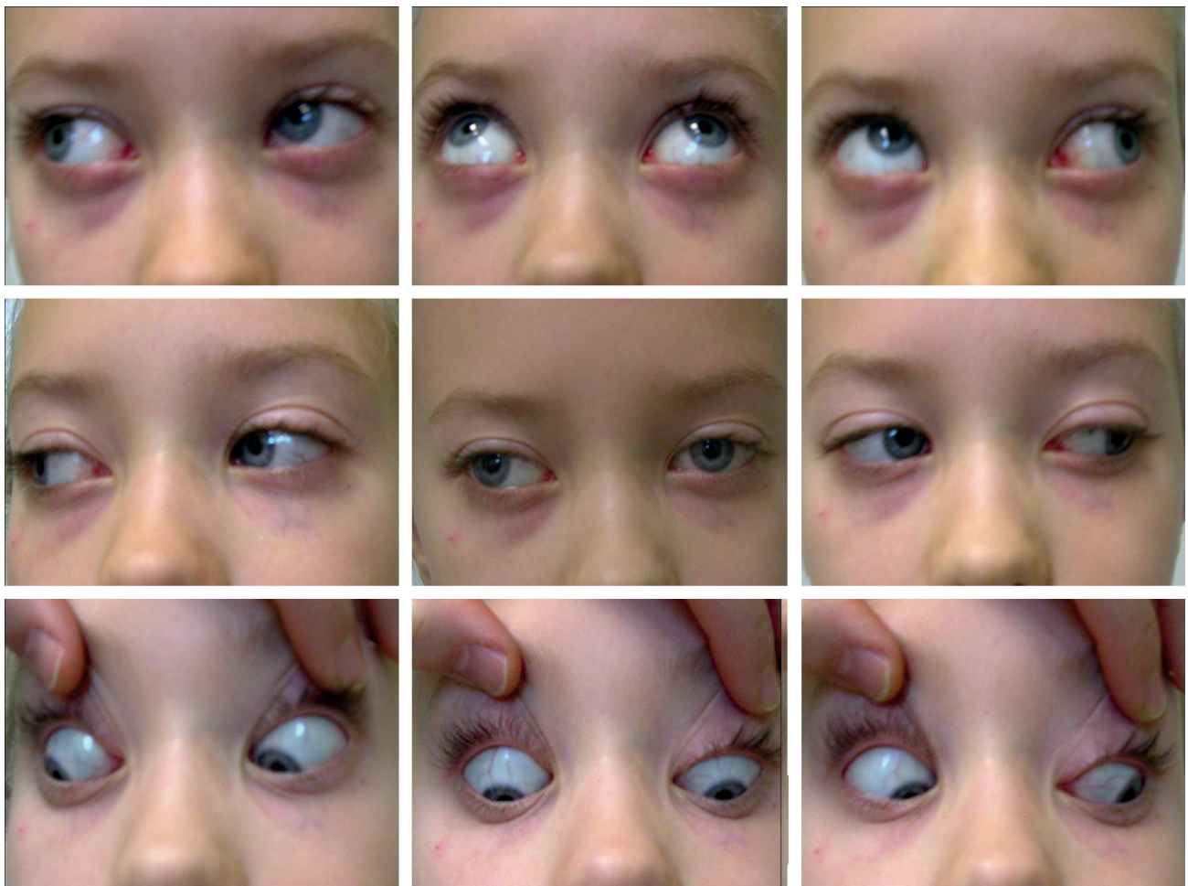
Obr. 4 Osmiletá pacientka – rozbor motility ve všech pohledových směrech u strabismu sursoabductoria