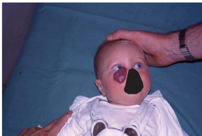
Obr. 3 Kapilární hemangiom dolního víčka u šestiměsíčního kojence

Nežádoucí účinky u našich pacientů jsou vcelku mírné. U pacientů s kortikoidní terapií jsme zaznamenali u jednoho pacienta lokální atrofii měkkých tkání a Cushingoidní projevy u pacienta, kde byl nasazen systémový kortikoid.