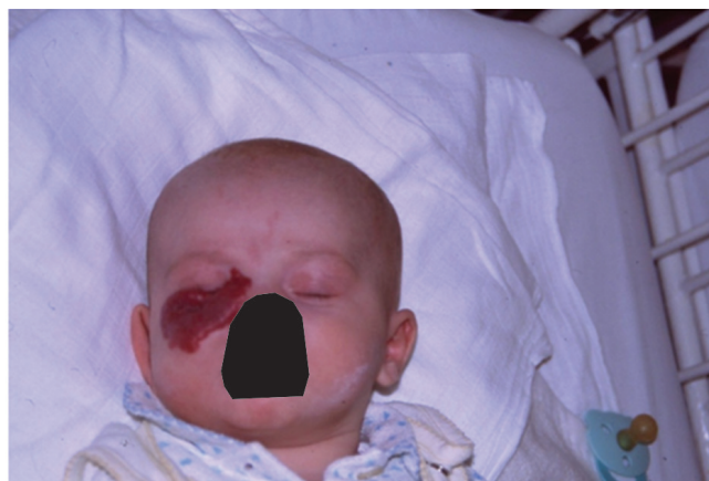
Obr. 4 Kapilární hemangiom dolního víčka u tříměsíčního kojence