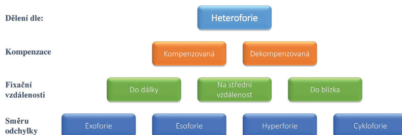
Obr. 1 Klasifikace heteroforií dle způsobu kompenzace, fixační vzdálenosti a směru odchylky (Evans, 2007)

Při posouzení akomodačních funkcí je rutinně ověřována zraková ostrost do blízka a dostupná amplituda akomodace (AA). Adekvátní hodnota AA však neeliminuje možnost poruchy akomodace [23]. V takovém případě může existovat problém s únavou akomodace (Ill-sustained akomodace), se snadností akomodace (infacilita akomodace) anebo neschopností relaxace akomodace. V případě potíží charakteristických pro akomodační poruchy je třeba komplexnější hodnocení akomodačního systému dalšími testy.