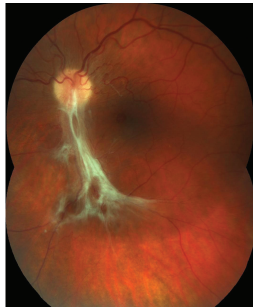
Obr. 5 Barevný fotografický snímek fundu levého oka: preretinální fibróza při dolní temporální arkádě způsobující nařasení sítnice v centrální krajině

Vyšetření předního segmentu na štěrbinové lampě odhalilo PAH OP s úponem distálního úseku k zadnímu pouzdru čočky (obr. 3), dále nález na OP i OL fyziologický. Fundoskopie v mydriáze OP ukázala proximální část PAH Inoucí k horní temporální arkádě, kde podmínila vznik lokálního TOS star-