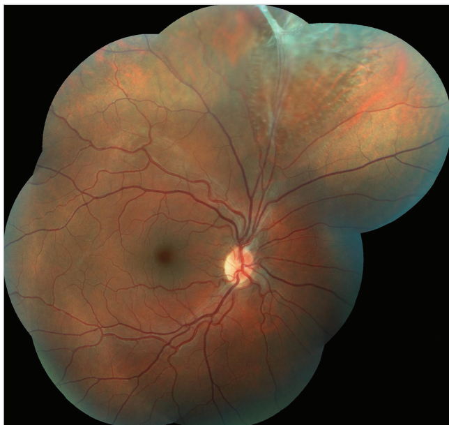
Obr. 1 Barevný fotografický snímek fundu pravého oka: sítnice je v horních kvadrantech prořídlá, při horní temporální arkádě jsou pozůstatky perzistující arteria hyaloidea s fibrotickou tkání způsobující lokální retinoschízu staršího data

viště ke zvážení dalšího postupu. Obě pacientky si dlouhodobě stěžovaly na postupně se zhoršující vidění a pocity tlaku v očích. Vyšetření očního pozadí v mydriáze odhalilo preretinální fibrózu způsobující v jednom případě lokální trakční odchlípení sítnice (TOS) a ve druhém případě lokální retinoschízu.