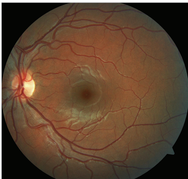
Obr. 2 Barevný fotografický snímek fundu levého oka: na očním pozadí fyziologický nález

První kazuistika: 15letá dívka byla na naše pracoviště odeslána spádovým očním lékařem ke zhodnocení očního nálezu po útoku chovankyněmi Dětského domova, kde byla opakovaně kopnuta do hlavy, především do oblasti pravého