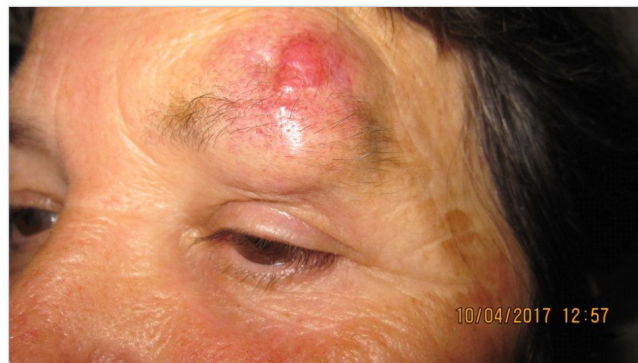
Obr. č. 4: Pacientka č. 2 - detail lézie v oblasti mihalnice supercília v apríli 2017