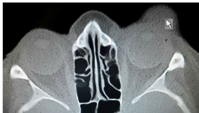
Obr. č. 5: CT snímka pacientky č. 2 – šipkou označené ložisko MCC