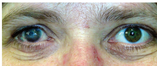
Obrázek 8 a 9. Pac. č. 4 pred a po zákroku KTP