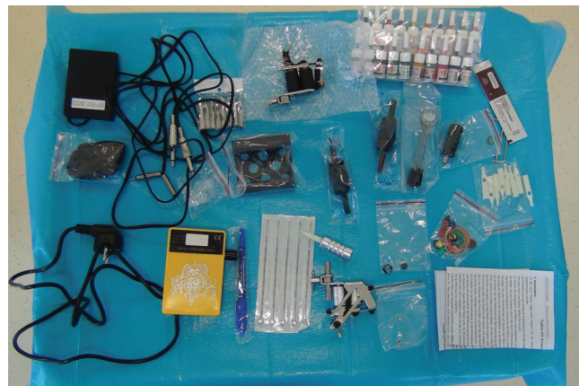
Obrázek 1. Tetovacia sada a pigmenty

Podľa zdravotnej dokumentácie pacient absolvoval niekoľko operácií ľavého oka (vrátane pars plana vitrektómie) v súvislosti s úrazom v minulosti. Objektívne najlepšia korigovaná centrálna zraková ostrosť (NKCZO) pravého oka bola 1,0 a u ľavého oka bola prítomná amauroza. Na rohovke ľavého oka bol sýty leukóm, v centre s náznakom zonulárnych zmien. Prítomný bol tiež divergentný strabizmus (ex anopsia) ľavého oka. Ultrasonografickým B scan vyšetrením sme verifikovali vysokú totálnu inveterovanú amóciu sietnice, vnútroočný tlak bol palpačne nižší – tlak nebolo možné