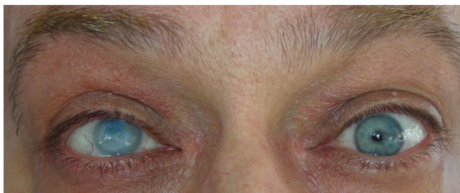
Obrázek 6 a 7. Pac. č. 3 pred a po zákroku KTP

V súčasnosti je preferovaným riešením u pacientov so slepým, kozmeticky závažne poškodeným okom nosenie farebnej kontaktnej šošovky, ktorú ale nie všetci pacienti dobre tolerujú. Perforujúca keratoplastika so všetkými známymi obmedzeniami a rizikami je taktiež príležitostne využívanou možnosťou. U najzávažnejších, a zároveň iným spôsobom nevládnuteľných prípadov je poslednou možnosťou niektorý z mutilujúcich zákrokov - eviscerácia alebo enukleácia bulbu s adaptáciou protézy [2].