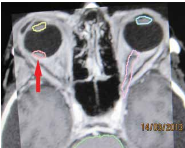
Obrázek 1. Nádorové ložisko – melanóm chorioidey v štádiu T1 - v blízkosti makuly zakreslené pred stereotaktickým ožiarением v r. 2013 – červená šípka

Analýzovali sme súbor 168 pacientov s malígnym melanómom corpus ciliare a chorioidey, ktorí podstúpili ste-